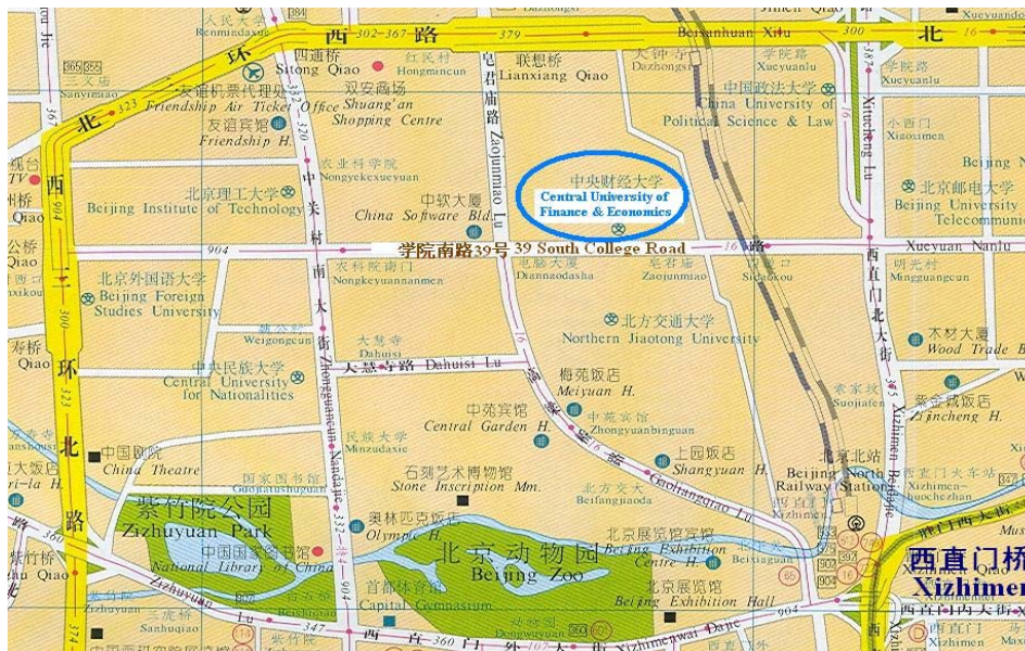
中央财经大学中国精算研究院地图

资产负债管理研究动态、财务学原理、系统科学、金融与投资数学、精算方法、精算规划与控制、财务与财务报表、商务统计、财务原理、市场学原理、风险融资及再保险学、金融机构风险管理、金融风险案例、新兴市场、市场管理、个人理财、管理学创新与变革、新式产品开发、市场策略新思维、公司风险管理、决策分析、投资市场、金融服务市场分析、固定收入组合管理、风险融资与再保险、公司估价、不动产金融及融资、金融服务管理、保险与税收，等等。